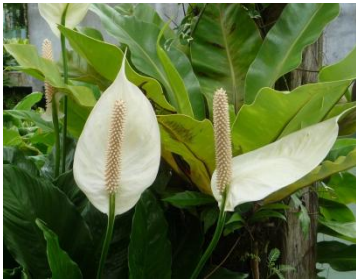
Peace Lily Flower