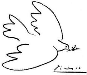
Pablo Picasso- Vredesduif, 1949