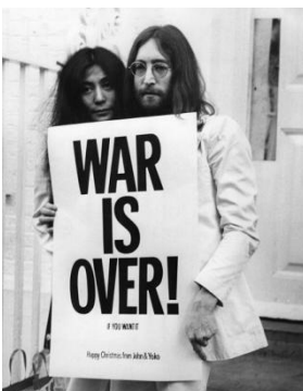
John Lennon – War Is Over

John Lennon schreef een nummer met de titel Make love not war. In 1973 gebruikte hij de slogan opnieuw in het nummer Mind Games. Een verwante slogan was Give Peace a Chance naar het gelijknamige lied, ook van Lennon en War is Over (If yo want it).