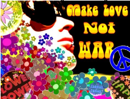
Make Love Not War

'Make love not war' is een slogan die veel werd gebruikt door hippies tijdens de Flower Power periode van de jaren 60 van de twintigste eeuw. De slogan werd toen gebruikt als protest tegen de Vietnamoorlog, de Koude Oorlog en tegen de atoombom. De slogan wordt nog steeds gebruikt en komt in bijna elke anti-oorlogdemonstratie weer terug.